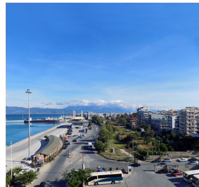
Πρώην σταθμός Αγίου Διονυσίου στην Πάτρα, 2015